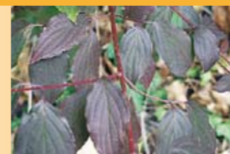
Roter Hartriegel Cornus sanguinea