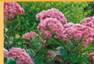
Gewöhnlicher Wasserdost Eupatorium cannabinum