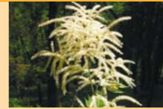
Waldgeissbart Aruncus dioicus