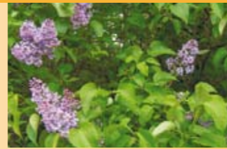
Gemeiner Flieder Syringa vulgaris