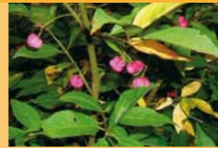
Pfaffenhütchen Evonymus europaeus