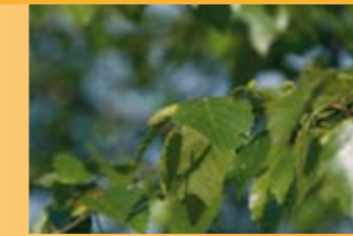
Birke Betula pendula