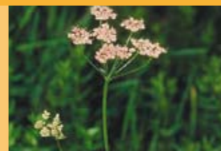
Grosse Bibernelle Pimpinella major