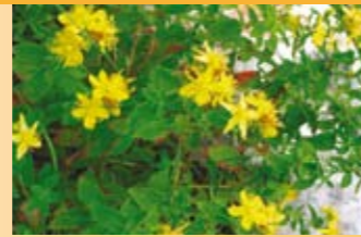
Johanniskraut Hypericum perforatum