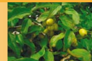
Kornelkirsche Cornus mas