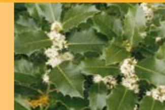
Stechpalme Ilex aquifolium