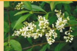
Gemeiner Liguster Ligustrum vulgare