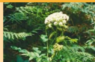
Wilde Engelwurz Angelica sylvestris