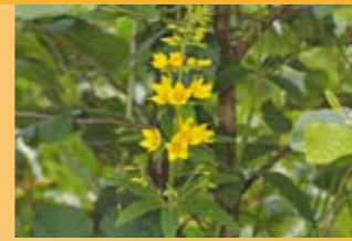
Gewöhnlicher Gilbweiderich Lysimachia vulgaris