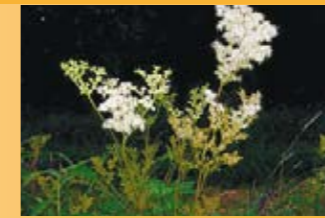
Mädesüss Filipendula ulmaria