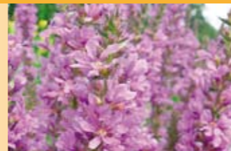
Blutweiderich Lythrum salicaria