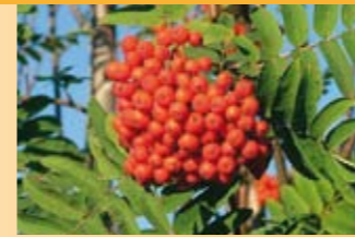
Vogelbeere Sorbus aucuparia