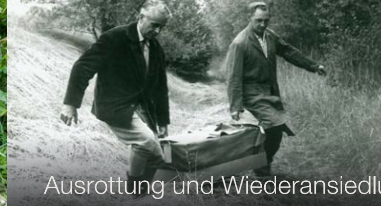
Ausrottung und Wiederansiedlung