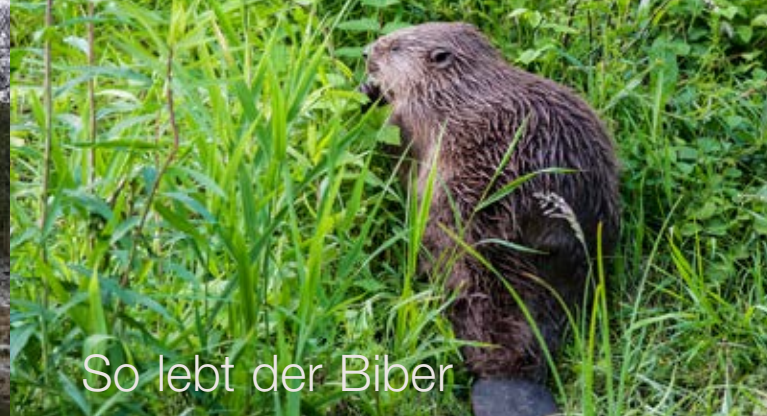
So lebt der Biber