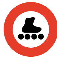
Verbot für fäG