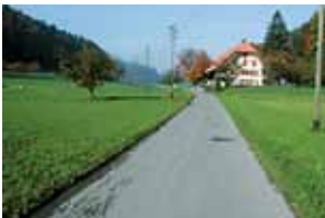
Verkehrsarme Nebenstrasse ohne Trottoir, Fuss- und Radweg