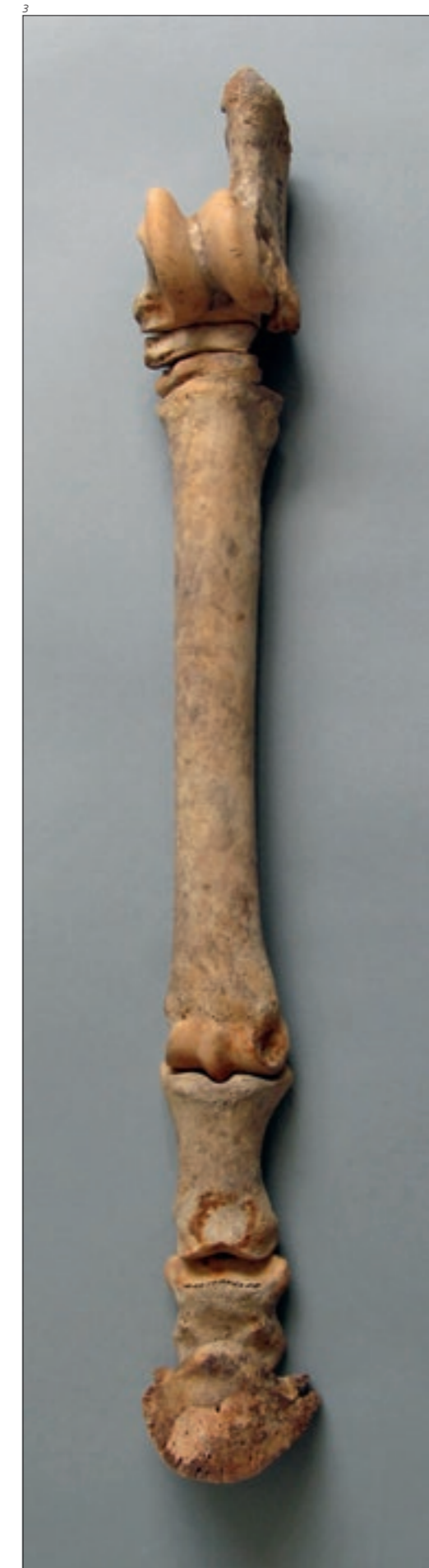
Abb. 3 Linker Hinterlauf vom Pferd im Keller 3b. Von oben nach unten: Calcaneus (mit Hundebiss- spuren), Astragalus, Os tarsale centrale, Os tarsale III, Meta- tarsus III (mit Schnittspuren), Phalanx I–III. Länge 53 cm. Nicht abgebildet ist der eben- falls nachgewiesene Neben- strahl-Metatarsus II.

Ein ungewöhnliches Resultat ergibt die Skelettteilanalyse der Schaf- und insbesondere der Ziegenknochen. Hier fallen 97 abgehackte Hornzapfen auf, die fast 50 Prozent aller Funde dieser beiden Tierarten ausmachen. Hornzapfen sind von vielen Blutgefässen durchzogene knöchernen Ausstülpungen des Schädels, auf denen die eigentlichen, aus Keratin bestehenden Hornscheiden sitzen. Andere Skelettteile, wie zum Beispiel die Metapodien, sind dagegen nicht über- oder unterrepräsentiert (Abb. 4). Bei den Hornzapfen handelt es sich bis auf wenige Ausnahmen um meist ganze Exemplare von fast immer weiblichen, ausgewachsenen Ziegen. Die Dominanz von weiblichen Tieren ist vermutlich darauf zurückzuführen, dass fast alle männlichen Tiere vor Erreichen der Geschlechtsreife geschlachtet wurden. Die Hornzapfen wurden alle so abgehackt, dass jeweils noch ein kleines Hirnschädelstück direkt an der Zapfenbasis verblieb (Abb. 5). Die übrigen Teile des