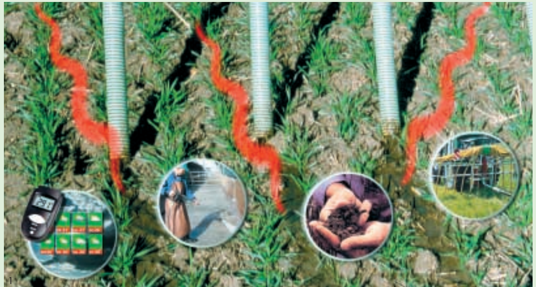
Ausbringzeitpunkt, Verdünnung der Gülle, Bodenzustand und Vegetation sowie die Ausbringtechnik beeinflussen die Ammoniakverluste bei der Hofdünger-Ausbringung.

In der Nacht ist die Luftfeuchtigkeit in der Regel höher und die Temperatur geringer als tagsüber. Deshalb geht bis zu 50 % weniger Ammoniak-Stickstoff verloren, wenn die Gülle abends ausgebracht wird.