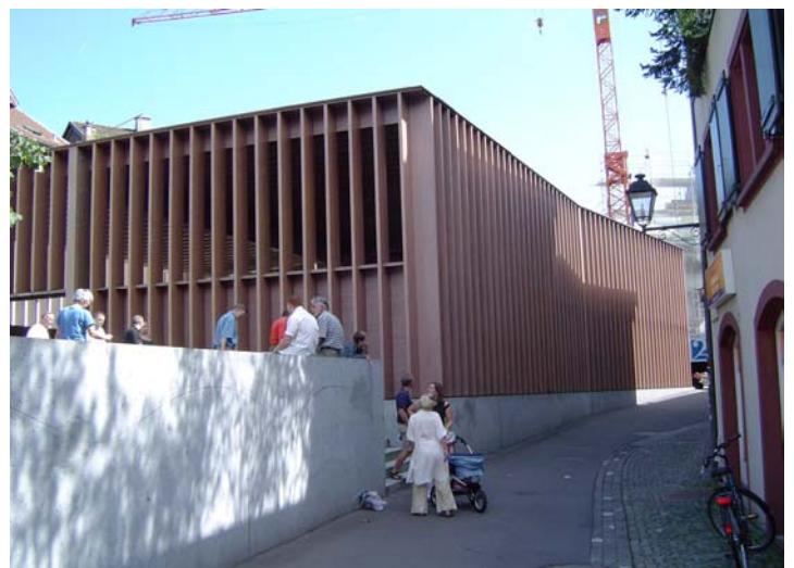
Markthalle Färberplatz Aarau Bauherrschaft: Einwohnergemeinde der Stadt Aarau

Die Markthalle besetzt die langgezogene Gasse zwischen dem inneren und äusseren Mauerring der Altstadt. Eine ungewöhnliche Konstruktion aus den zahlreichen nahe beieinander stehenden Holzlamellen definiert ein klar umrissenes Bauvolumen und verleiht diesem die architektonische Form. Die Markthalle Aarau demonstriert mit der gewählten Konstruktion die neuesten Möglichkeiten des modernen Holzbaus hinsichtlich Präzision und Finesse. Die Halle wird an rund 150 Tagen pro Jahr an verschiedene Organisationen zu äusserst günstigen Bedingungen vermietet und bietet Raum für Veranstaltungen jeglicher Art.