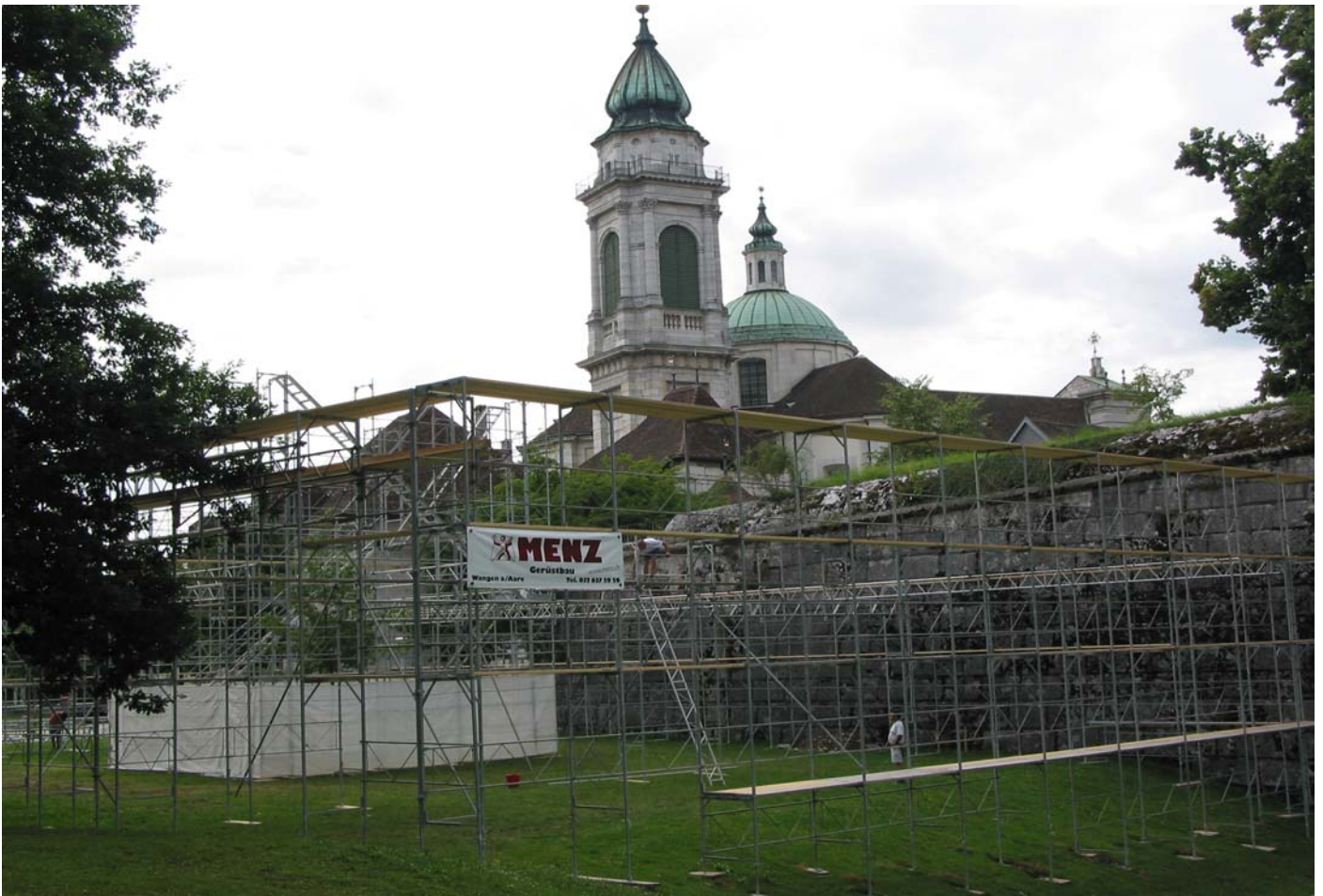
Sonderschau-Pavillon vor malerischer Kulisse im Aufbau