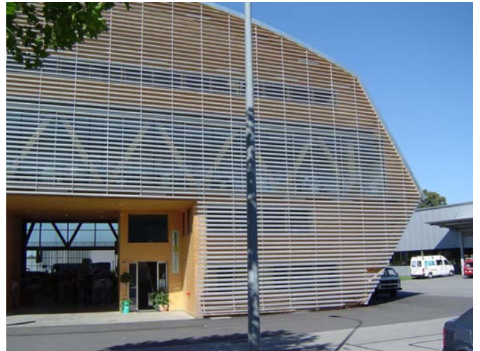
Werkhalle und Büros Hector Egger Holzbau AG, Langenthal

Die Fabrikationshalle entspricht dem neuesten Stand der Technik, mit dem ausgezeichnetes Komfortniveau bezüglich Luftqualität, thermischer Behaglichkeit und Schutz gegen Aussenlärm sowie eine überdurchschnittliche Werterhaltung erreicht werden kann.