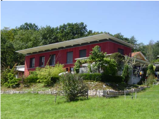
Doppeleinfamilienhaus Schilling, Hägendorf

Eine innovative Bauweise steckt im Doppeleinfamilienhaus Schenker / Schilling in Hägendorf. Anstelle der bekannten Rahmenbauweise setzte die Bauherrschaft auf vorfabrizierte Tafелеlemente in der Rippenplattenbauweise.