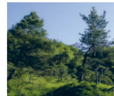
Ein Eldorado für Spezialisten. Dank der lichten Bestockung entwickelt sich eine artenreiche Gras-, Seggen- und Krautvegetation mit verschiedenen Lilien- und Orchideenarten (Hummel-Ragwurz).