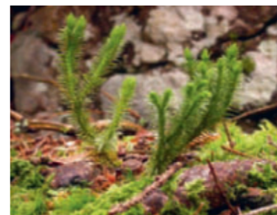
Tannen-Bärlapp mit Moosen auf dem Blockschutt.

Der Blockschutt-Fichtenwald birgt etwas Mystisches, Märchenhaftes. Die Rohhumusaufgabe und die darauf wachsenden Pflanzen sehen aus wie aus einer anderen Welt. Den tiefen Klüften zwischen den grossen Felsblöcken entströmt im Sommer kalte und im Winter warme Luft: Waldschratt und Feen können nicht fern sein.