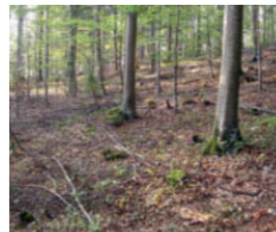
Vollkommen naturgemäss – ein fast reiner Buchenwald.

Während der Vegetationszeit spendet die Buche mit ihrem ledrig-dunkelgrünen Blattwerk viel Schatten und erträgt diesen genau so gut. Auf den meisten Jurastandorten dominiert sie deshalb alle anderen Baumarten mit Ausnahme der Eibe.