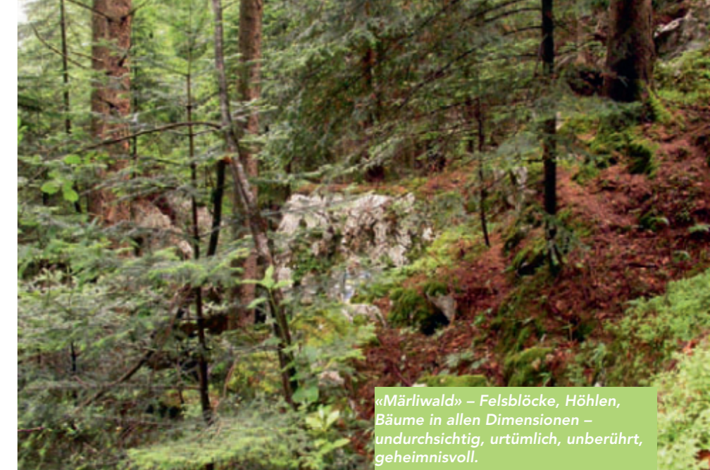
«Märlwald» – Felsblöcke, Höhlen, Bäume in allen Dimensionen – undurchsichtig, urtümlich, unberührt, geheimnisvoll.

Mergel besteht aus Staub und Ton mit unterschiedlichem Anteil an Kalk. Dieses Gemenge wird bei Regen sofort nass und bei anhaltender Trockenheit staubtrocken und hart. Nur die Waldföhre, die Mehlbeere und der Faulbaum lassen sich davon nicht abschrecken. Durch periodische Pflege wird die Strauchschicht im Zaum gehalten.