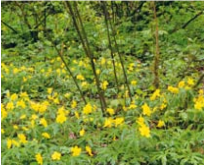
Gelbes Windröschen, Charakterart der Auen

grün der röhrichtartigen Felder des Winterschachtelhalmes und der Efeumäntel um die Baumstämme in Erscheinung. Willkommene Farbtupfer bringen rot leuchtende Himbeerblätter und die Früchte des Pfaffenhütchens.