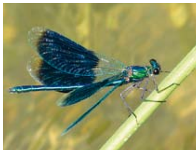
Die gebänderte Prachtlibelle, Charakterart der Fliessgewässer