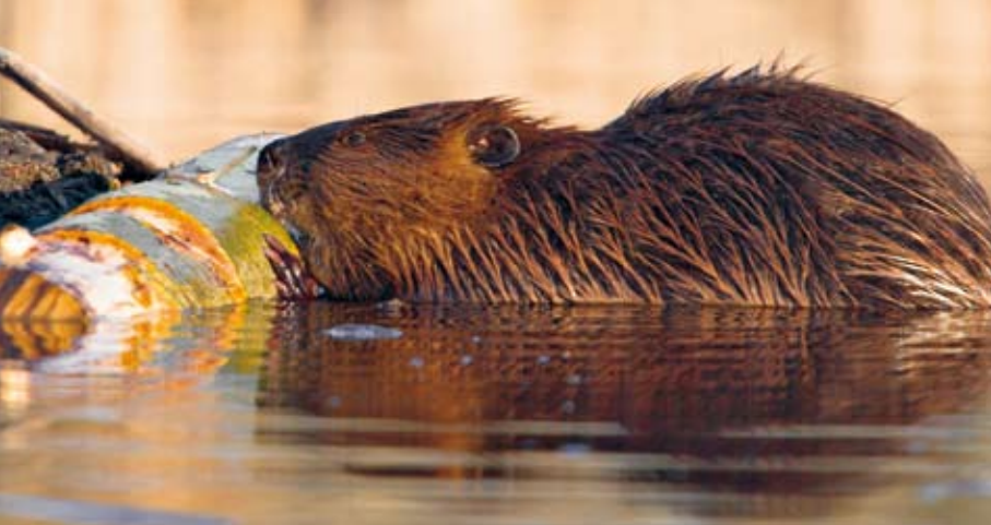
Der Biber ernährt sich von Baumrinde

Flussauen gehören zu den artenreichsten Lebensräumen der Schweiz. Viele an die Flussdynamik angepasste Tier- und Pflanzenarten sind trotz Wasserkraftnutzung auch an der Aare zwischen Olten und Aarau zu beobachten.