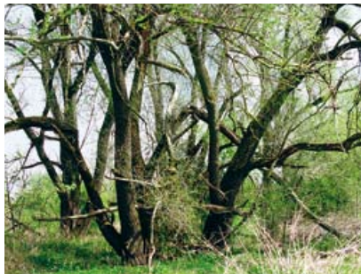
Die überflutungsresistente Silberweide