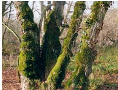
Die selten gewordene Schwarzpappel