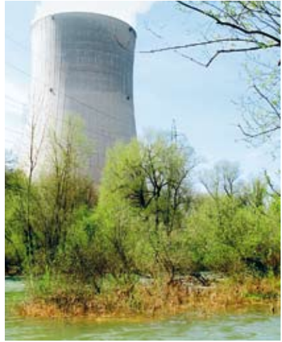
Wildnis und Zivilisation