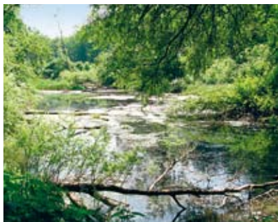
Altarm im Obergösger Schachen

Trotz Restwasser und dank Hochwasser finden sich am Aarelauf noch typische Auelemente eines dynamischen Mittellandflusses: Leer gespülte, kahle wie auch sonnige Sand- und Schotterbänke werden rasch von Weidenkeimlingen bewachsen, die aufkommenden Gehölze von den reissenden Hochwassern gebeugt. Deren Wurzeln ertragen auch längere Überflutung und befestigen den Boden. Wo die Überflutungen seltener und kürzer werden, haben sich dschungelartige, mit Lianen behangene Hartholzauenwälder entwickelt. Andersorts hat man die einst nutzlos gewordenen, geplünderten Auengebüsche geräumt und nach forstlichen Grundsätzen in wirtschaftlich wertvolle Laubmischwälder umgewandelt.