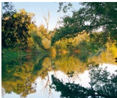
Spätsommer bei Gretzenbach