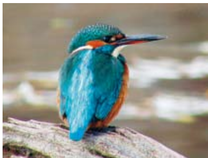
Der Eisvogel, Juwel der Flussauen