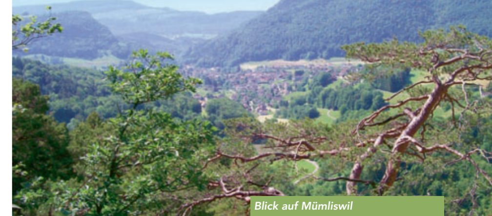
Blick auf Mümliswil