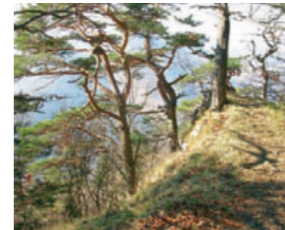
Föhren auf dem Chellenchöpfli

Wo Wind und Wetter um die Ecken pfeifen, wo es keinen Schutz vor sengender Sonne und eisiger Kälte gibt, kein Wassertropfen vom Boden aufgesogen wird, behaupten sich Föhre und Flaumeiche als Überlebens-künstler. Das sind wahre Höhepunkte für den Wanderer – was die Freude am Reichtum der Flora und die Aus-sicht ins weite Land hinaus betrifft.