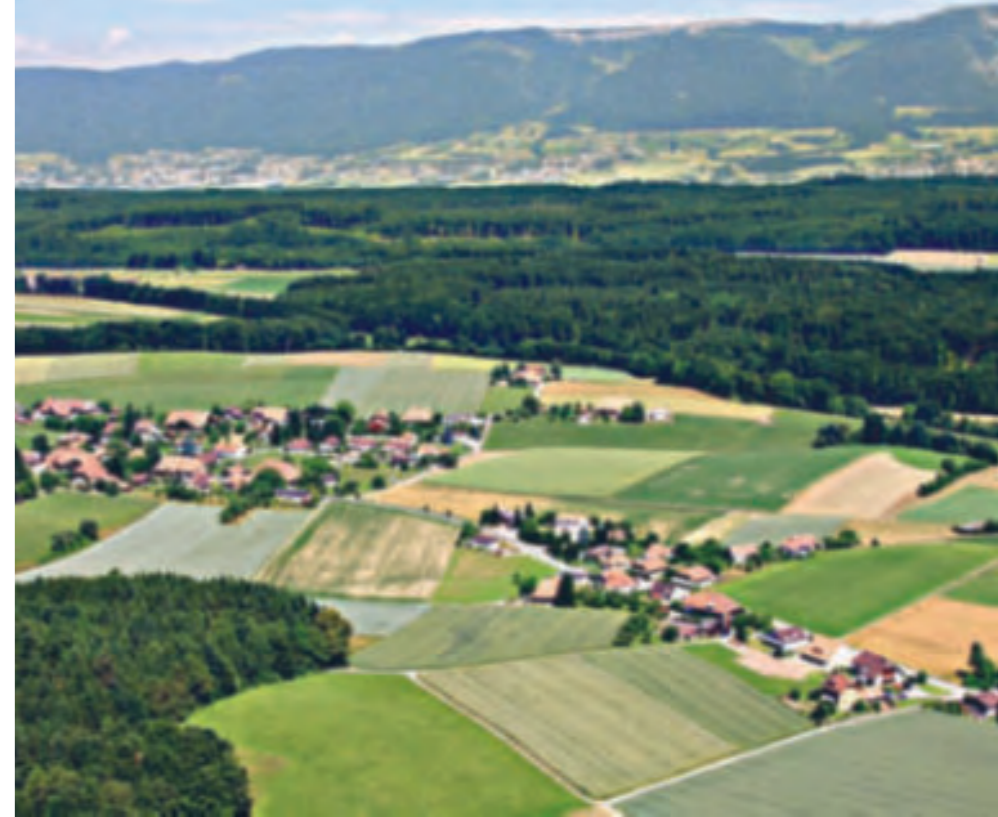
Blick auf Brügglen und Jura