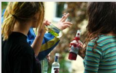
Eine Gruppe junger Menschen feiert, trinkt Alkohol und raucht