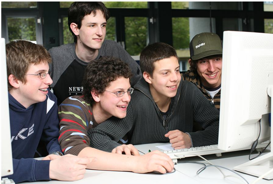
Jugendliche von einer Berufsschule arbeiten mit feelok (15. April 2008)