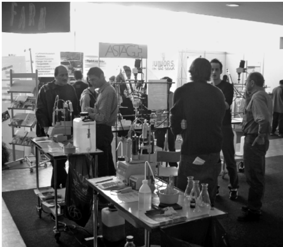
Die Messestände bieten Orientierungshilfe und wertvolle Kontakte zur Berufswelt.

Unser Tipp zur Recherche im Internet: www.berufsberatung.ch