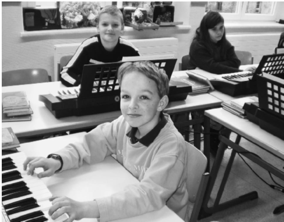
Musikunterricht mit Pfiff.

Es besteht neben dem Besuch der ganzen Kurswoche auch die Möglichkeit, jedes Premiere-Highlight und die Stufengruppen (Unterrichtsplanung) einzeln zu belegen.