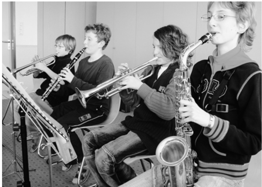
Musikerziehung fördert einer Studie zufolge die Konzentrationsfähigkeit, das soziale Verhalten und das Selbstbewusstsein von Kindern.

Die Grundkurse sollen Lehrpersonen befähigen, einen breiten Musikunterricht zu erteilen. Er deckt alle musikalischen Bereiche und Arbeitsfelder ab, ist niederschwellig und praxisorientiert. Das An-