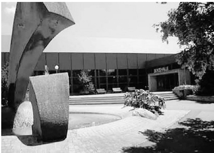
Die Oltner Stadthalle im Kleinholz.