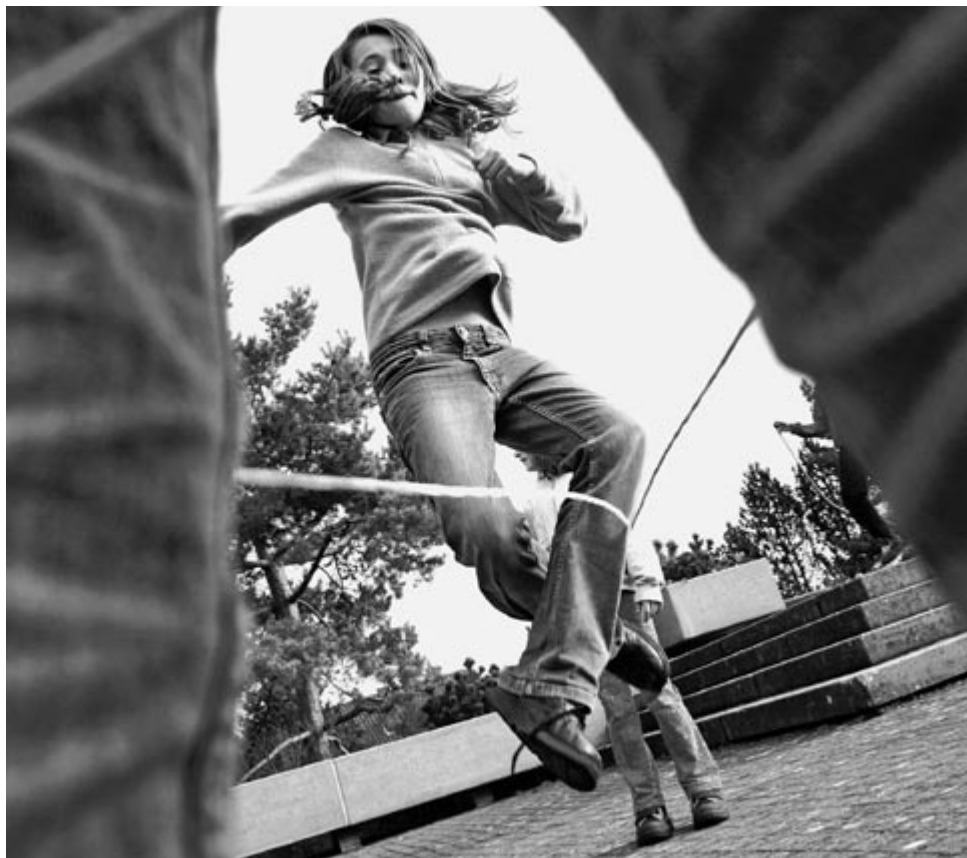
«schule.bewegt» Bewegung tut gut und ist gut!

Als Lehrperson erhalten Sie Bewegungsideen in Form eines Kartensets: Einfach hervorheben und umsetzen. Die Bewegungsübungen erfordern keine Vorbereitung.