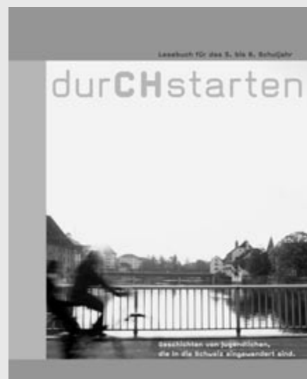
«durCHstarten». Lesebuch für das 5. bis 8. Schuljahr. 174 Seiten, 17 x 21,5 cm, broschiert, farbig illustriert. Lehrmittelverlag Kanton Solothurn, Preis Fr. 28.60. www.lehrmittel-ch.ch

sowie zu Einwanderung, Ausländerrecht und Bildung in der Schweiz. Dreizehn Studierende der Pädagogischen Hochschule FHNW in Liestal haben im Rahmen eines Ausbildungsprojektes die Übersetzungen der muttersprachlichen Texte organisiert und Texte für den Informations- teil verfasst.