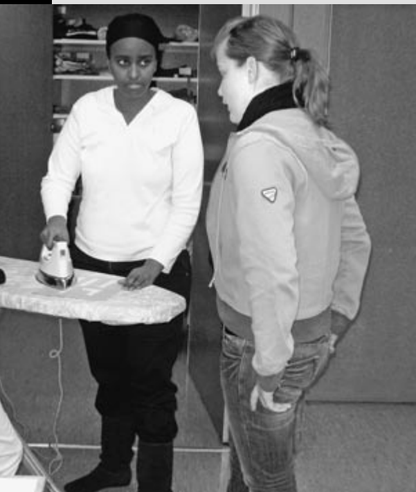
HWJ-Lernende beim Bügeln.

Auf Grund der hohen Stoffdichte braucht es eine gute Auffassungsgabe. Weiter gefragt sind Freude an hauswirtschaftlichen Tätigkeiten und die Bereitschaft, sich am Ausbildungsplatz in das Familienleben zu integrieren.