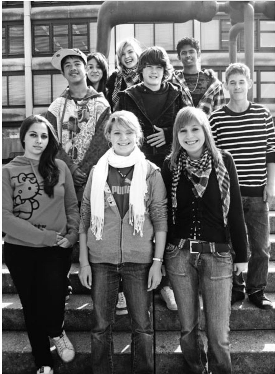
Sie haben viel Selbstvertrauen gewonnen, die BVJ-Lernenden an der GIBS Olten.

Die Einladungen an die Schulleitungen erfolgen demnächst. Weitere Infos finden Sie auf der Homepage der GIBS Olten: www.gibsolten.so.ch