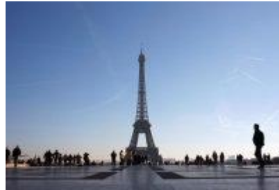
La tour Eiffel

La tour Eiffel est un symbole de Paris, de la France même. Comme l'étaient autrefois les Twin Towers à New York. À ce titre elle se trouve dans une liste de cibles (Ziel) prioritaires pour les terroristes d'Al-Qaida selon (gemäss) les services secrets américains (CIA) et la chaîne de télévision Fox News.