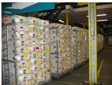
Verpackte CC Container