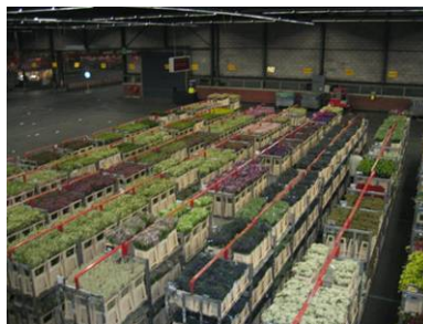
Blumen in den riesigen Container