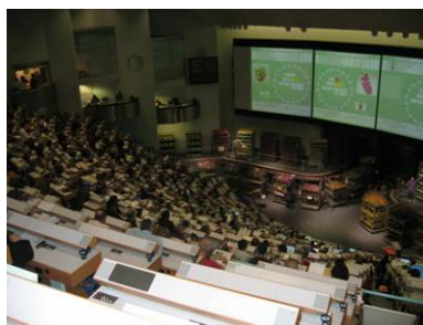
Händler beim Ersteigern