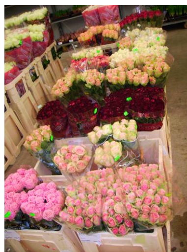
Ware in Hollandkisten

Die Ware aus Ecuador geht über Miami nach Zürich, von Zürich zum Großhandel und vom Großhandel in unsere Blumengeschäfte. Bis sie aber bei uns im Geschäft ist, braucht sie 5 Tage. Ware aus Holland braucht nur 3 Tage, da der Weg viel kürzer ist und nicht noch mit dem Flugzeug oder Schiff transportiert werden muss.